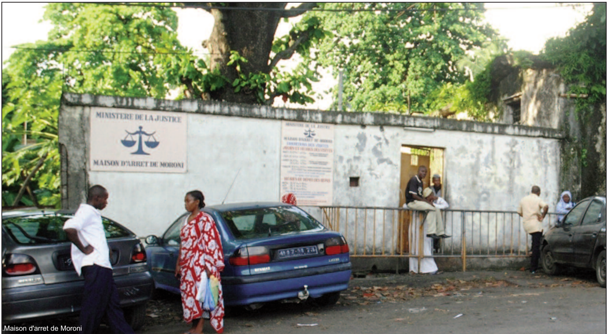
Maison d'arrêt de Moroni

La BCC lance une procédure judiciaire contre les activités off-shore de banque à Anjouan et Mohéli