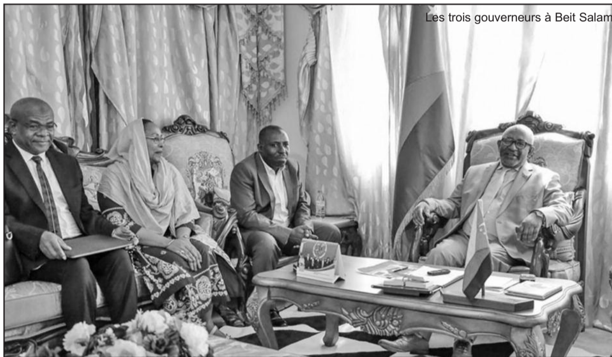
Les trois gouverneurs à Beit Salam

Selon le site de la présidence de l'Union, le chef de l'Etat a reçu hier lundi, dans la matinée, les Gouverneurs des Îles autonomes de Ngazidja, Ndzuwani et Mwali.